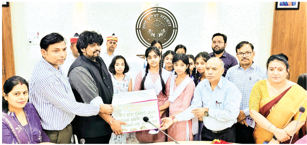
बालिका इण्टर कॉलेज महरौनी की छात्राओं ने 1000, राजकीय इण्टर कॉलेज बार से 1000, राजकीय इण्टर कॉलेज जखौरा से 1000, राजकीय हाईस्कूल दावनी से 44, नगर पालिका बालिका इण्टर कॉलेज ललितपुर की छात्राओं ने 500 तथा श्री दिगम्बर जैन